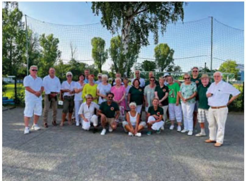
Zufriedene Bouler*innen freuen sich auf die neue Spielzeit 2023