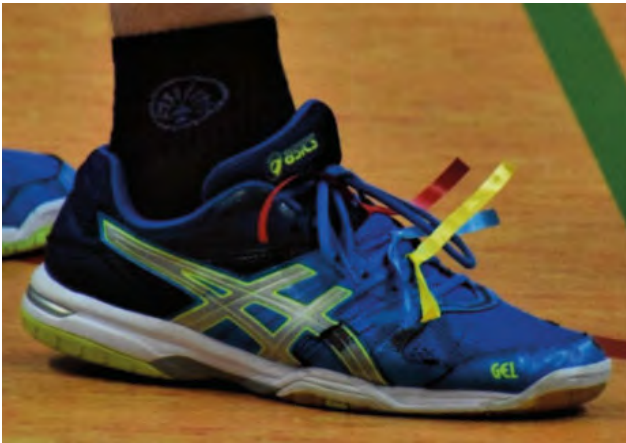
Schon dreimal gewonnen!

Ein Schleifchenturnier läuft folgendermaßen ab: Es werden feste Zweierteams gebildet, die über den gesamten Turnierverlauf zusammenbleiben. Jeweils drei Zweierteams bilden eine Mannschaft.