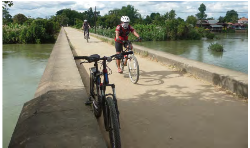
Bahntrassenradeln in Laos

Das STADTRADELN ist eine internationale Kampagne des Klima-Bündnisses. Allein in Deutschland beteiligten sich im letzten Jahr fast 2600 Kommunen an der Aktion. Auch 17 SKGler haben im „Team KulturRadeln“ 2022