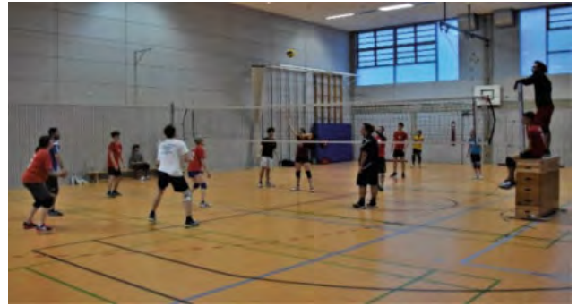
Zweierteams in Aktion

Insgesamt hatten sich 16 Spieler:innen zusammengefunden. Nach der Auslosung der Zweierteams konnte ein vergnüglicher Nachmittag beginnen. Dieser folgte einem ausgeklügelten Spielplan, nach dem jedes Zweierteam mindestens einmal mit jedem anderen Zweierteam zusammen in einer Mannschaft war; und außerdem einmal die Schiedsrichterfunktion übernehmen musste.