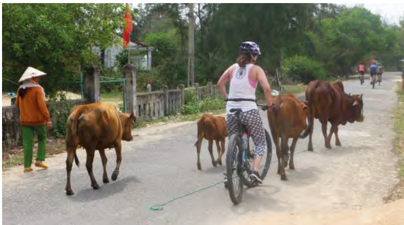
Radlspass in Vietnam

Ich habe die folgenden sechs Touren geplant und werde dazu drei Vorträge mit Bezug zu den Touren halten. Einigen Lesern wird aus dieser Liste das Eine oder Andere bekannt vorkom-