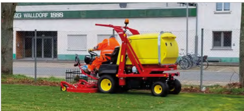
Der erste Schnitt des neuen Rasens

Letztes Jahr wurden von der Stadt Mörfelden-Walldorf die Vereinsbezuschussungsrichtlinien neu überarbeitet. In den Vereinen und in der Vereinskommision wurde die Überarbeitung sehr kritisch gesehen, deshalb wurde ein neuer Entwurf vorgelegt. Die Stadt hatte zugesagt, dass die Vereine hierdurch keine Nachteile haben werden. Dies sehen wir weiter-