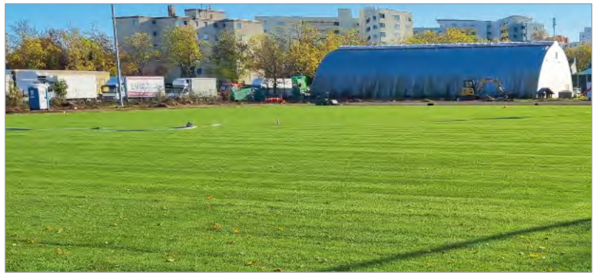
Eine satte grüne Fläche

Nachdem uns unser vormaliger Hausmeister Ende 2022 verlassen hat, haben wir im