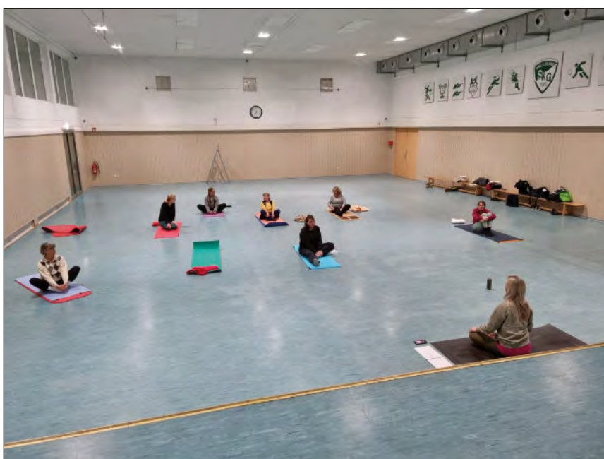
Noch viel Platz für weitere Interessenten

(sr) Im Januar 2022 haben wir ein neues Kapitel in der Turnabteilung aufgeschlagen.