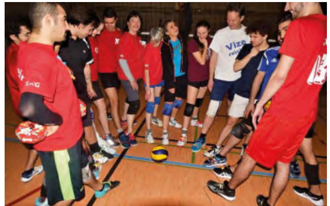
Zwischenstandprüfung: Alle haben Schleifchen am Schuh

Wir hatten alle den Ehrgeiz, uns so viele Schleifchen wie möglich zu verdienen, und dadurch hatten wir gute und schnelle Spiele.