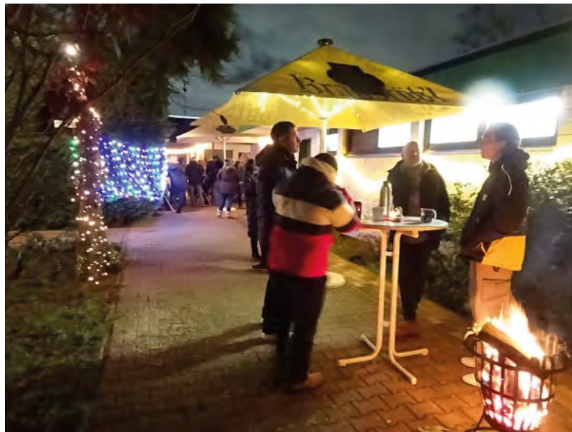
Lichtermeer beim Glühweinabend

Dieser Antrag wurde auf der Erweiterten Vorstandssitzung der SKG Walldorf am 19. Juli einstimmig angenommen. Am 13. September wurde der Einspruch des Mitglieds gegen das Ausschlussverfahren einstimmig abgelehnt und der Vereinsausschluss somit bestätigt. Damit war der formale Prozess abgeschlossen, das Thema aber nicht beendet.