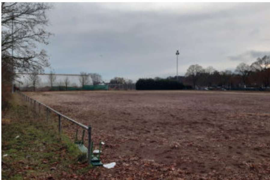
Der Platz des Anstoßes und der Veränderung

Langeweile kommt aber trotzdem nicht auf. Die Umsetzung des Winterrasens mit Sitztribüne beginnt voraussichtlich im Frühjahr 2021 und wird ca. zwölf Wochen bis zur Fertigstellung dauern. Voraussetzung ist, dass die Zuschussanträge an die Stadt, den Kreis Groß-Gerau und über den Sportkreis an das Land Hessen zeitnah befürwortet werden.