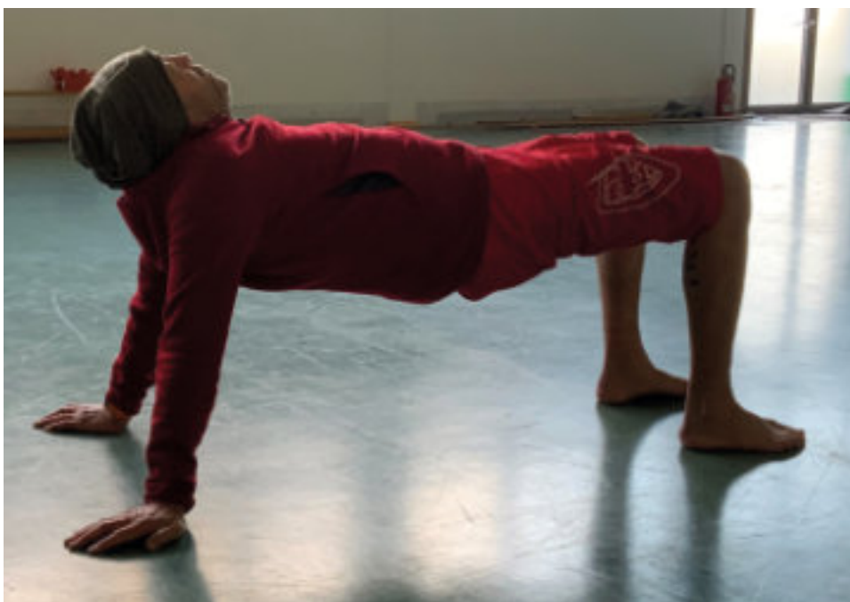
Krabbenstand - einer der fundamentalen Positionen des PRIMAL MOVEMENTS