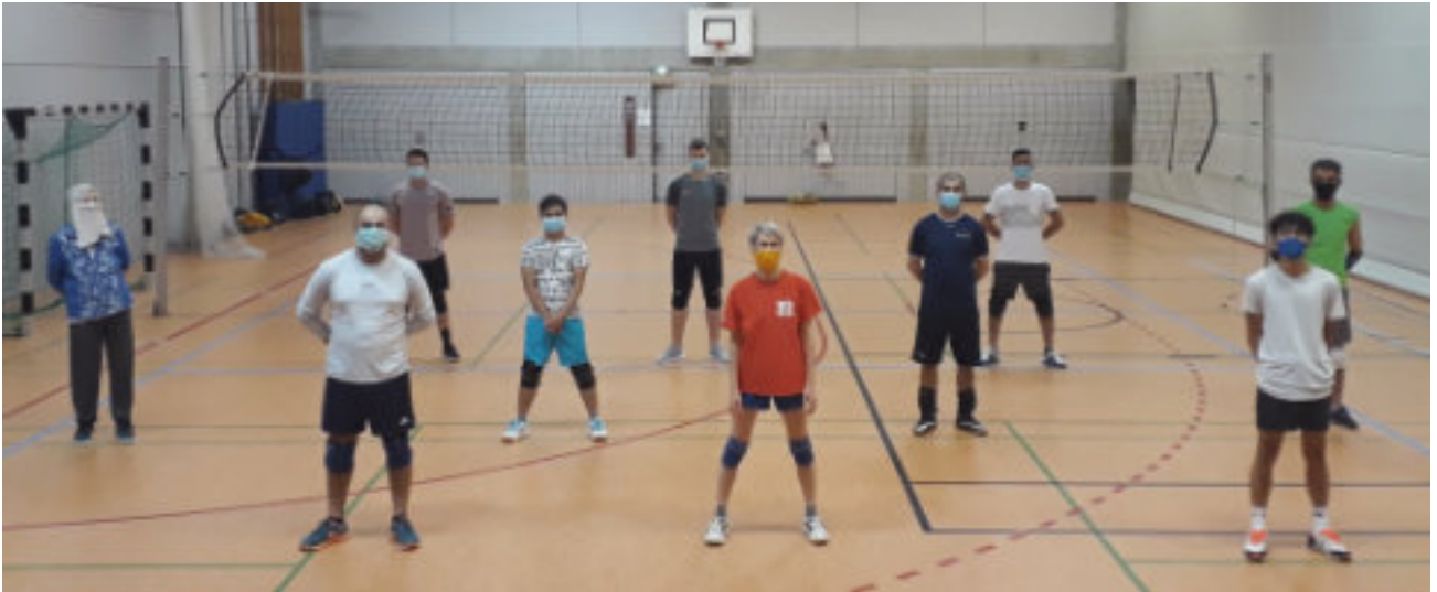
Bleibt gesund!

Außerdem gab es noch einige sportartspezifische Regeln. Der Ball wird von allen benutzt, also haben wir sichergestellt, dass er alle 30 Minuten desinfiziert wurde.