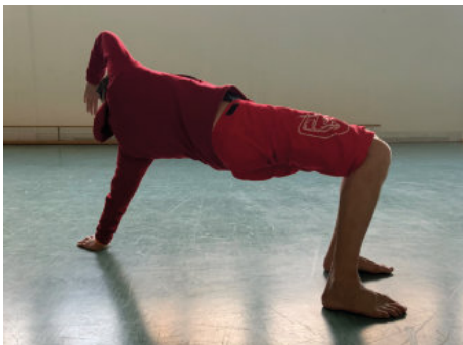
Stretchübungen für den gesamten Körper

Bei PRIMAL MOVEMENTS werden tierische Bewegungselemente nachgeahmt und zu einem Workout vereint, das deinen Körper ganzheitlich trainiert. Bei den ersten Versuchen wirst Du Muskeln spüren, deren Du dir vorher nicht bewusst warst. Deine Konzentration wird gesteigert, es hilft Dir beim Entspannen, und verbessert Deine Beweglichkeit.