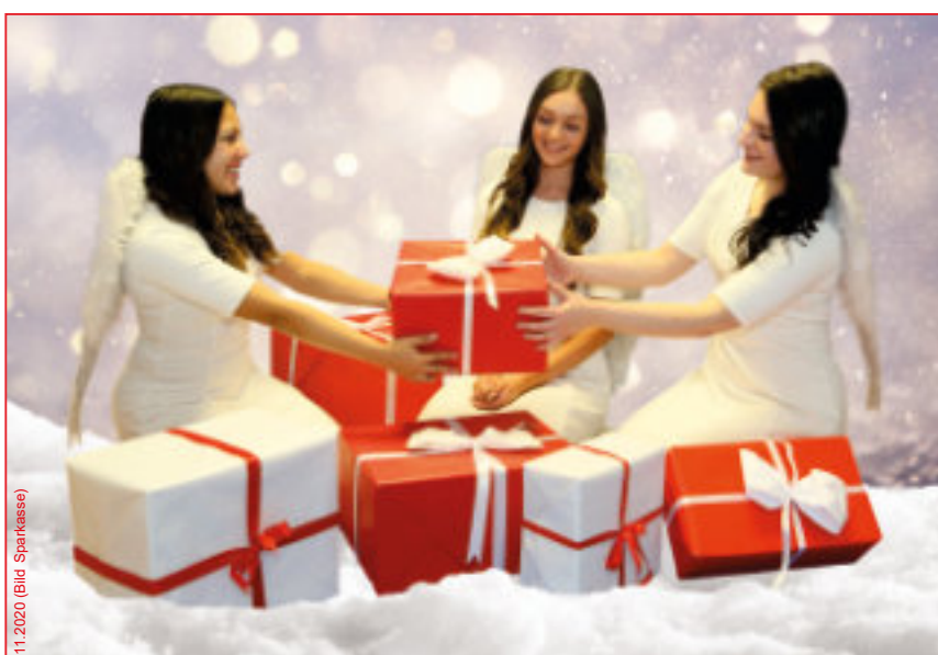
11.2020