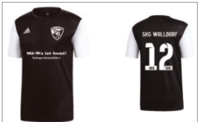
Die neue Kollektion der SKG Fußballer

Die für Ende Oktober geplante Jahreshauptversammlung der Abteilung musste wegen der Corona Bestimmungen ausfallen und wird nachgeholt.