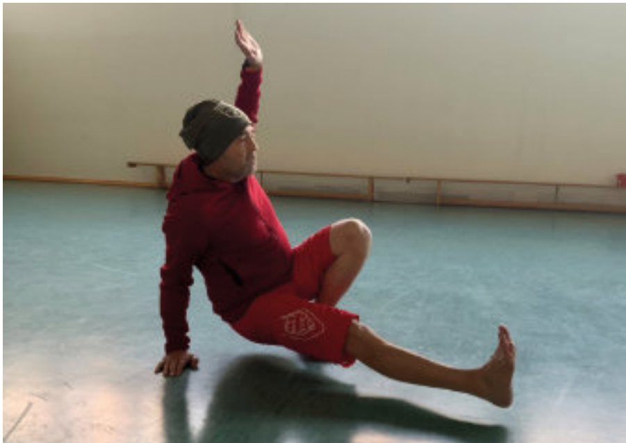
Bewegungen, die einzelne Positionen kombinieren, um in den Flow zu gelangen

die Anforderungen, die seine Umgebung an ihn stellt, erfordern.