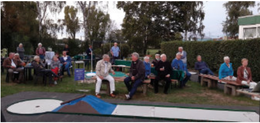
Ein besonderer Höhepunkt des Sommerfestes war die Dia-Schau mit Fotos aus den zurückliegenden 25 Jahren.

lung stetig entwickelt und zählt jetzt 35 Mitglieder, von denen regelmäßig über zwanzig auf den sechs Boulebahnen spielen. Bei den monatlichen Stammtischen werden alle anstehenden Themen besprochen. Dadurch und die rege Kommunikation bei den Spielen hat sich ein ausgeprägtes Gemeinschaftsgefühl entwickelt.