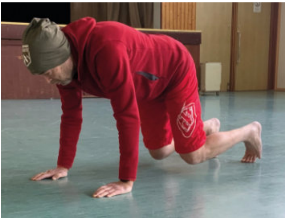
Raubtierstand oder Vierfüßlerstand - einer der fundamentalen Positionen des PRIMAL MOVEMENTS

perspannung, Gleichgewichtssinn und Beweglichkeit. Zugegeben, das sieht manchmal etwas gewöhnungsbedürftig aus, macht aber unglaublich viel Spaß und hält nicht nur den Kreislauf fit! Und das Beste ist: Man braucht dafür keinerlei Ausrüstung, sondern trainiert nur mit dem eigenen Körpergewicht.