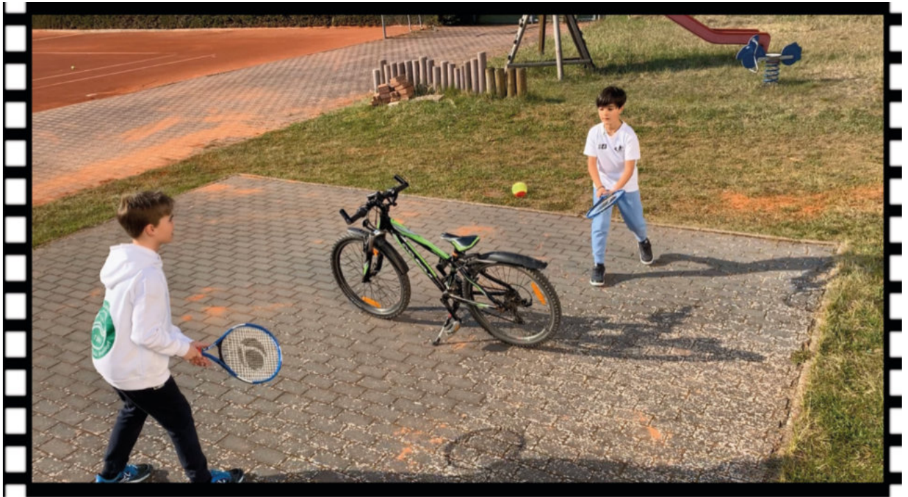
Mit dem notwendigen Sicherheitsabstand ...

Bälle fliegen. Um der Wahrheit bezüglich der digitalen Kommunikation jedoch die Ehre zu geben – es war nicht der Vorstand, der zuerst die Möglichkeiten von Webcams für „wir bleiben im Kontakt“ im Club erkannten.