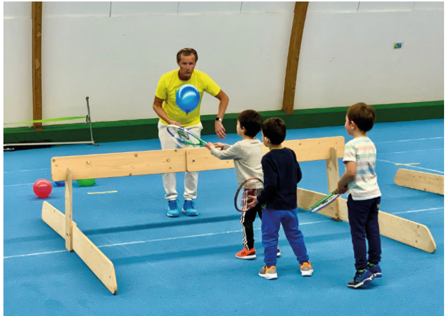
Ein Netz muss nicht zwingend immer ein Netz sein

Einer der Gründe war sicherlich, dass in den vergangenen Jahren viele Jugendliche in mehreren Mannschaften in der Woche und am Wochenende gespielt haben. Dazu gehörte auch eine nicht unerhebliche Bereitschaft der Eltern zur Unterstützung und Förderung solcher Aktivitäten, die sich heute leider auch sehr überschaubar darstellt. Gleichzeitig ist das „Konkurrenzangebot“ durch andere Sportarten doch stark gestiegen.