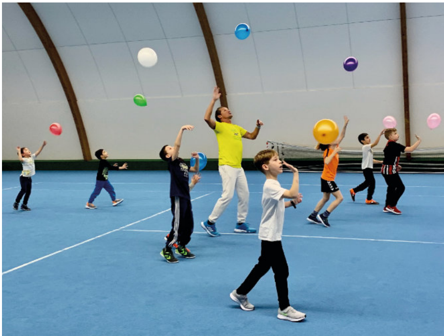
Wenn der Tennisball ein Luftballon ist und der Schläger der Arm