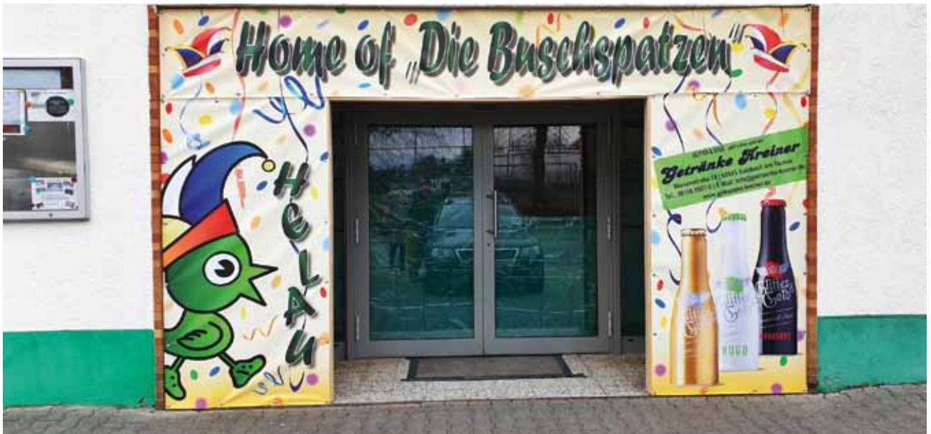
Der Eingang der SKG Halle, das Narrentor „Home of Die Buschspatzen“

(mh) Nachdem die 5. Jahreszeit bereits am 11.11.2018 gebührend eingeläutet wurde (wir berichteten im letzten SKG Journal, Ausgabe 03.2018), begann jetzt die heiße Phase der Hallenfastnacht. Am Eingang wurde genau angezeigt, wo's lang geht zum „Home of Die Buschspatzen“.