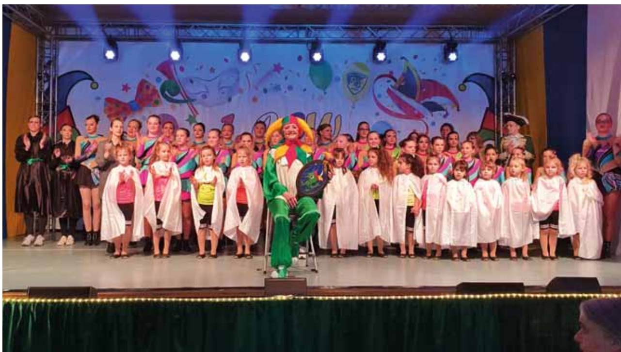
Till mit den Gardemädels

Applaus wurde die Kostümsitzung bis in die späte Nacht gefeiert. Die „Zwoa Spitzbuam“ spielten den Kehraus bis lange nach Mitternacht, als sich die ersten Sitzplätze lichten. Alle Narren freuen sich schon riesig auf den