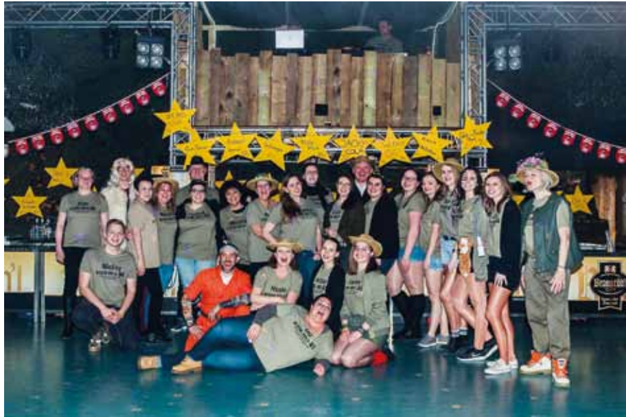
Das Service-Team der Buschspatzen am „Rummel im Busch“.