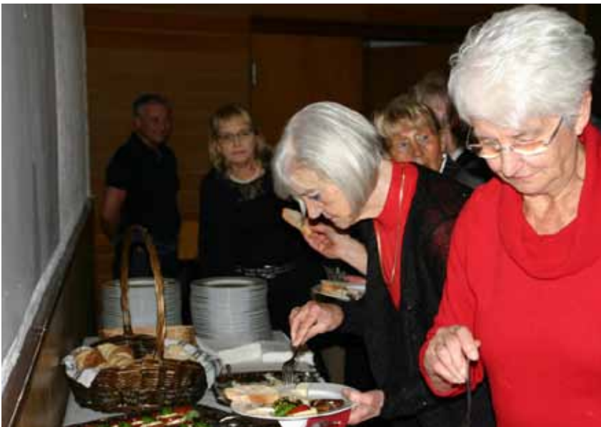
Für jeden Geschmack gedeckt.