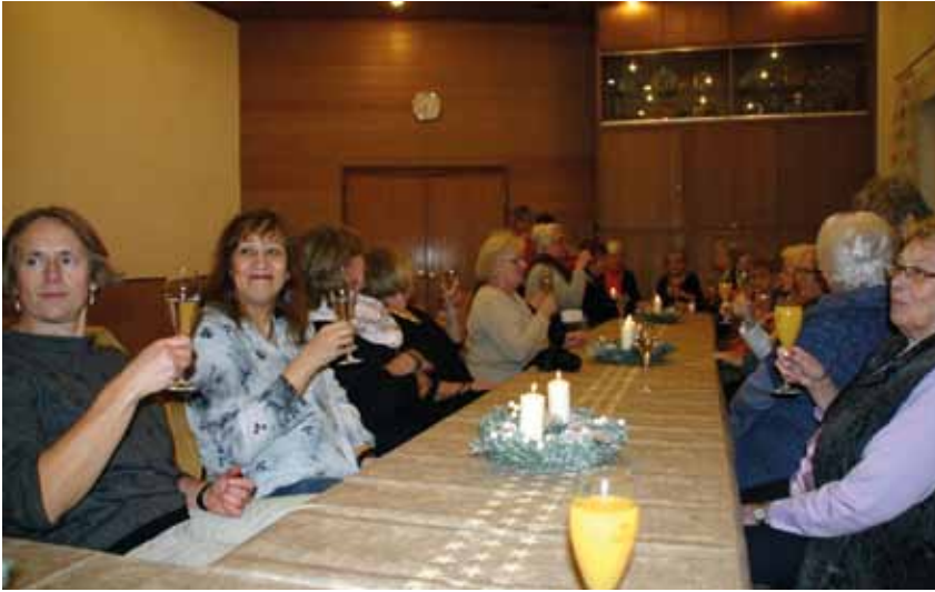
Zu Beginn war der Tisch noch unbelebt