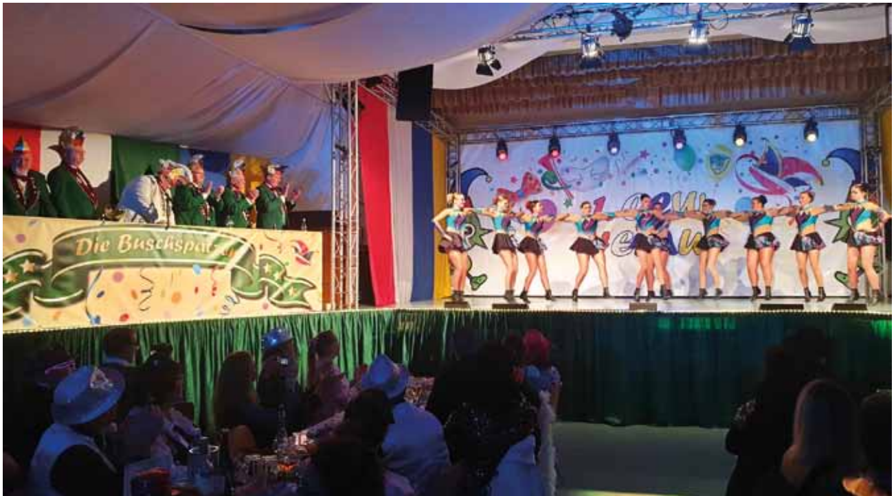
Die Garden tanzten, tanzten und tanzten