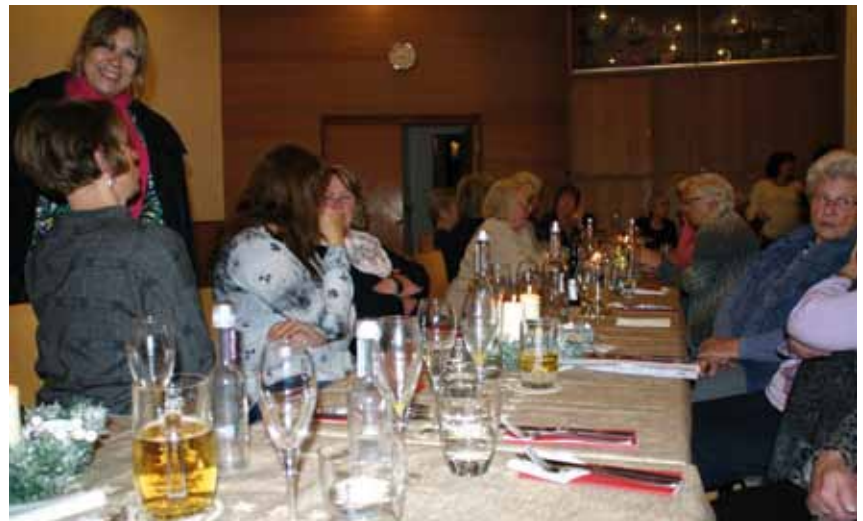
Zum Schluss war es schwer, noch ein freies Plätzchen zu finden

Zur Einstimmung gab es für Jeden ein Glas Sekt. Auch