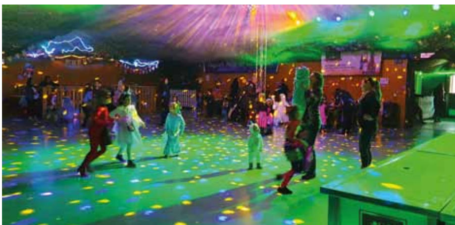
Die Kinder hatten viel Spaß beim Tanzen.

Die SKG Halle musste nach diesen beiden Veranstaltungen wieder komplett umdekoriert werden. Alle Einrichtungen für die zwei Rummel im Busch-Parties mussten wieder